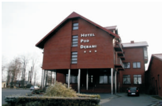
Hotel Pod Dębami w Kobylanach