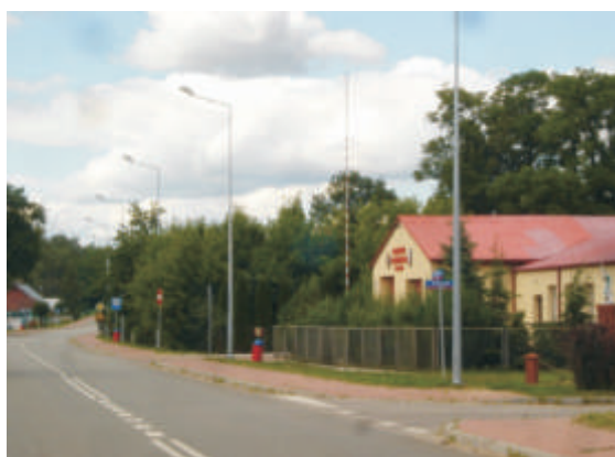
Zmodernizowana droga wojewódzka w Neplach