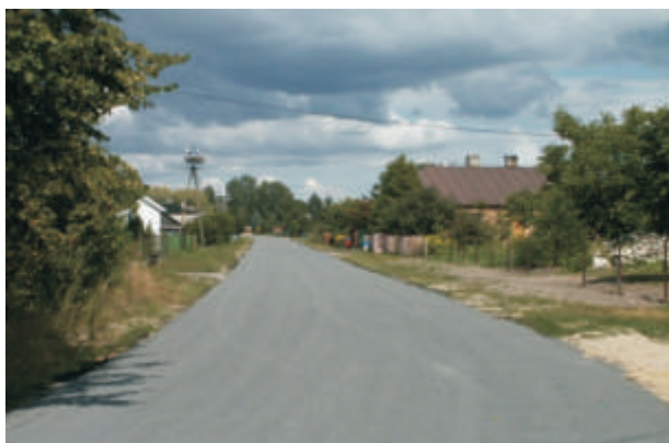
Michalków- droga przez wieś