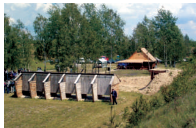
Strzelnica sportowa na forcie w Kobylanach