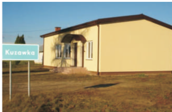
wietlica wiejska w Kuzawce