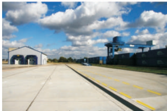
Centrum Logistyczne PKP CARGO w Małaszewiczach