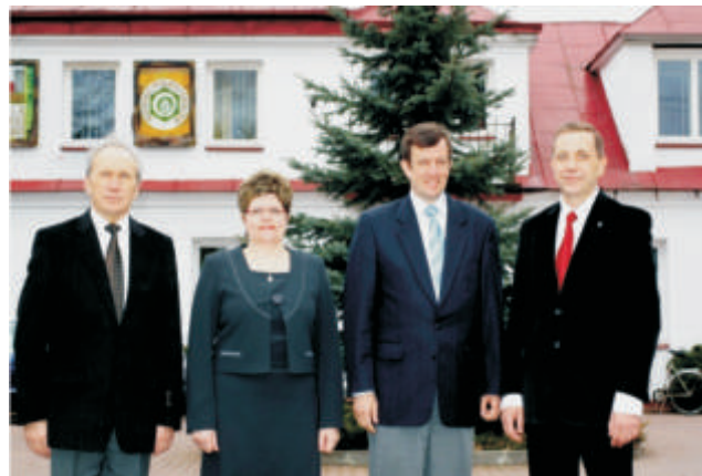
Władze gminy Terespol - nieprzerwanie od 20 lat

W 1992 roku gmina liczyła ponad 8 tys. mieszkańców, dziś jest nas o tysiąc mniej, na koniec 2011 roku gminę zamieszkiwało niewiele ponad 7 tys. osób.