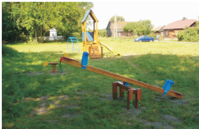
Plac zabaw w Samowiczach