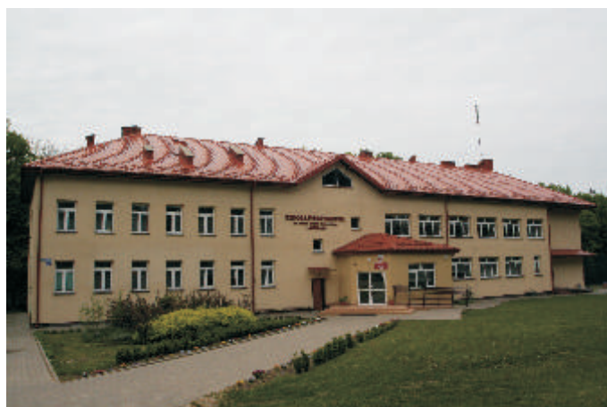
Szkoła Podstawowa im. J. U. Niemcewicza w Neplach