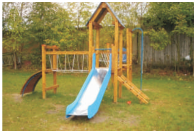
Plac zabaw w Bohukałach