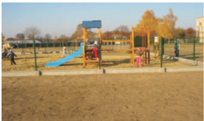
Plac zabaw w Koroszczyne