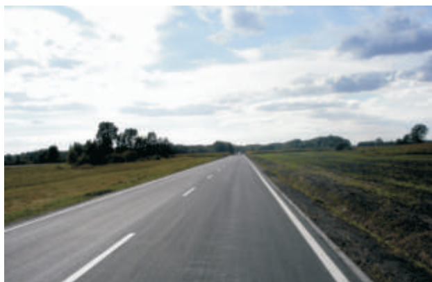
Ulica Wspólna w Lebiedziewie