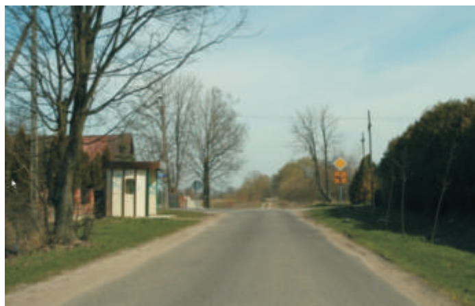
Ulica Spółdzielcza w Łobaczewie Małym