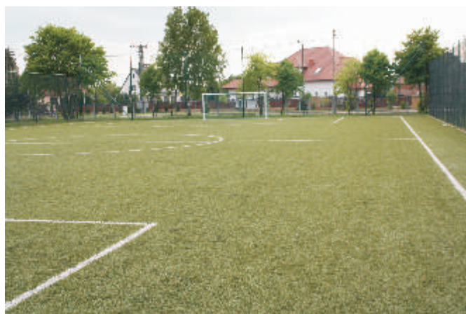
Kompleks sportowy przy szkole w Małaszewiczach