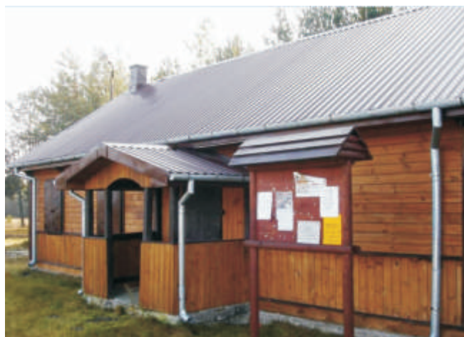
wietlica wiejska w Zastawku