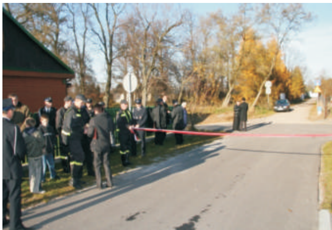
Droga od Nadbudówki do pałacu w Krzyczewie