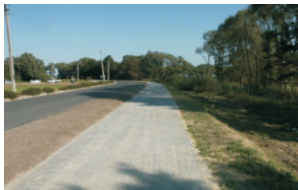
ścieżka rowerowa w Kobylanach