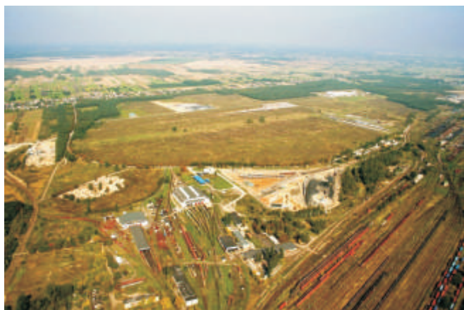
Wolny Obszar Celny Małaszewicze

Radykalnie zmieniły się te obiekty przejściowo graniczne z charakterystycznym Terminalem samochodowym w Koroszczynie, który jest wizytówką naszej granicznej gminy.