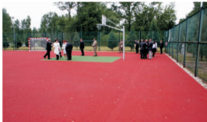
Kompleks sportowy przy szkole redziej