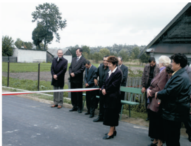
Murawiec – otwarcie drogi