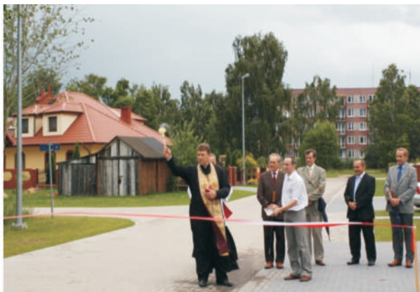
Małaszewicze – otwarcie ulic na „nowym” osiedlu: Wrzosowa, Spacerowa, Długa, Piłkarska, Wspólna, Wesoła, Spokojna, Boczna, Ciasna, Podleśna