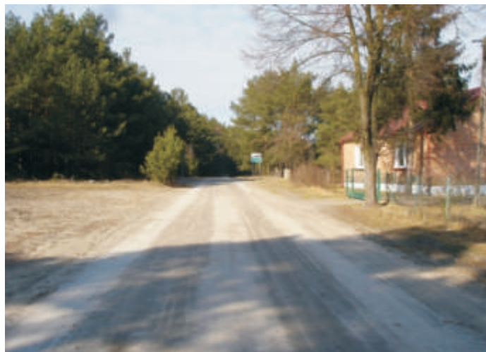
Ulica leśna w Koroszczynie