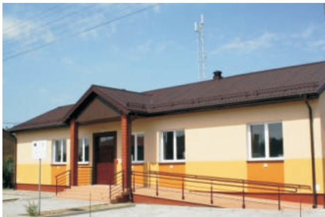
wietlica wiejska w Małaszewiczach Dużych