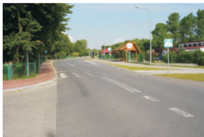
Ulica Piłsudskiego w Koroszczynie – droga powiatowa po modernizacji