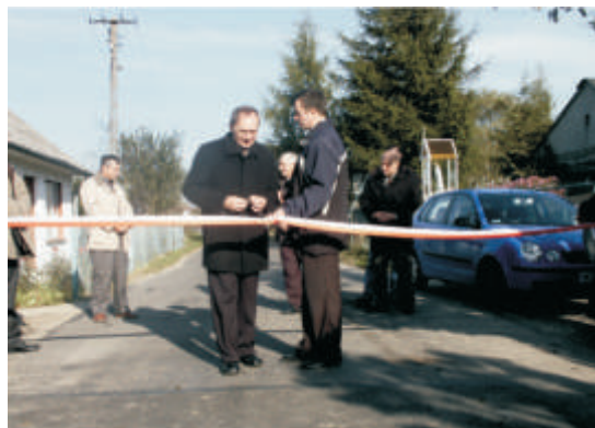
Starzynka – otwarcie drogi przez wieś