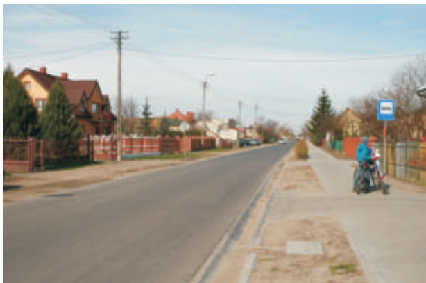
Zmodernizowana droga wojewódzka przez Łobaczew Duży