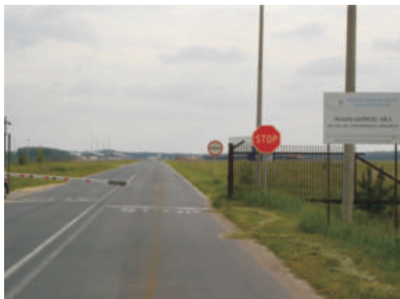
Droga dla ruchu towarowego na WOC