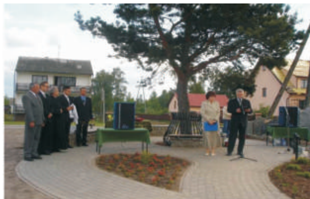
Małaszewicze – otwarcie ulic na „starym” osiedlu: Wiejska, Słoneczna, Cicha, Miła, Jasna, Kościelna, Krótka, Leśna, Nowa