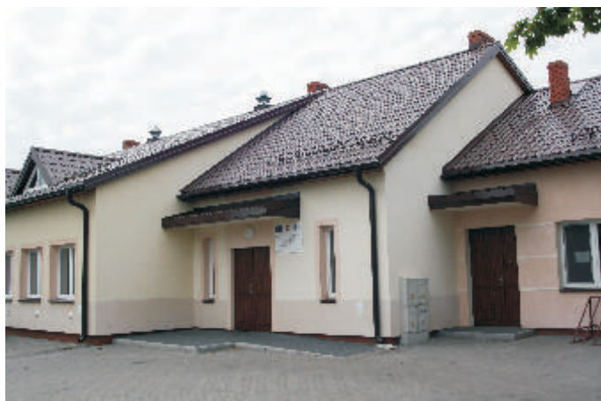
wietlica wiejska w Łobaczewie Małym