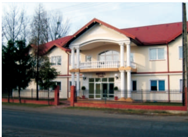
Hotel Feniks w Małaszewiczach