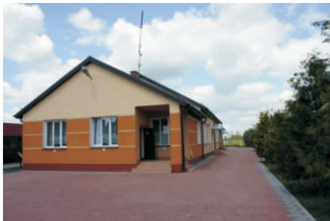
wietlica wiejska w Małaszewiczach Małych