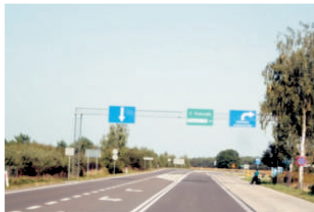
Zjazd z krajowej 2 do Terminala Samochodowego