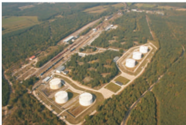
Operator Logistyczny paliw Płynnych w Małaszewiczach