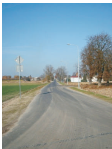
Koroszczyn - Ulica Słoneczna