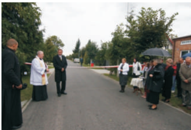
Łobaczew Mały – otwarcie ulicy Piłkarskiej