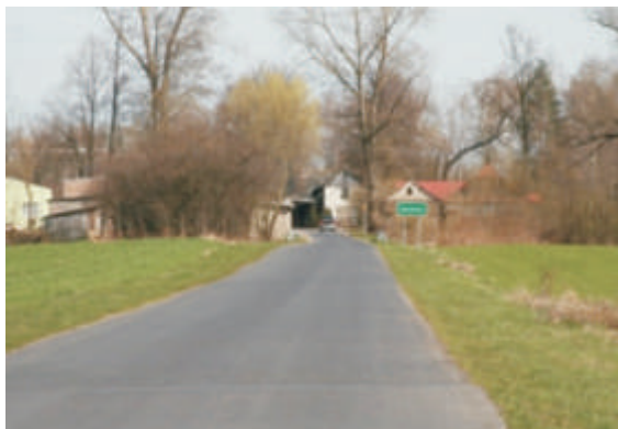
Samowicze - droga dojazdowa do wsi