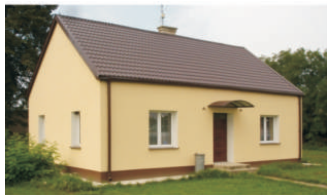
wietlica wiejska w Lebzdzewie