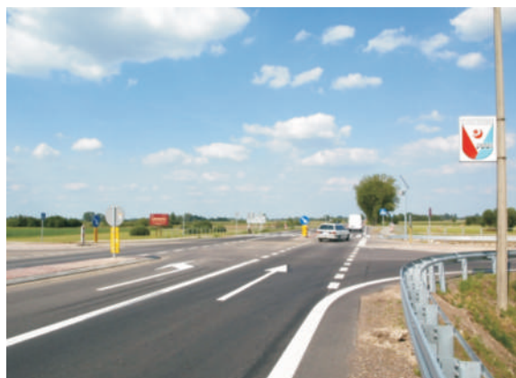
Zmodernizowana droga krajowa nr 2 przebiega przez gminę