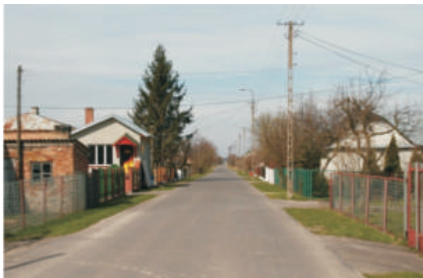
Lechuty Duże – droga przez wieś