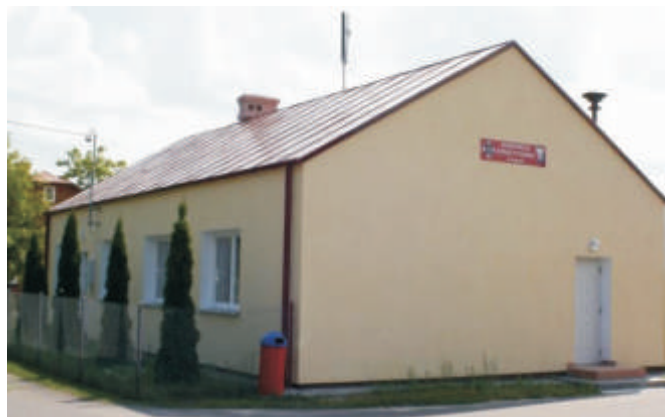
Remizo wietlica w Łęgach