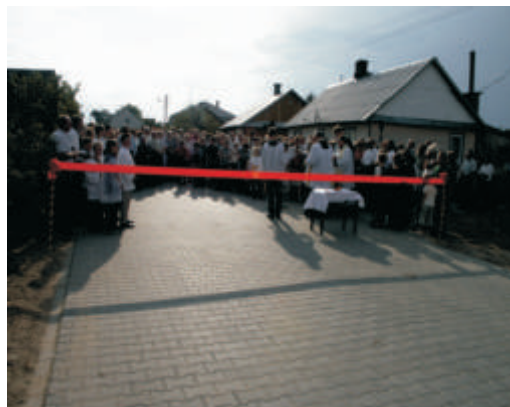
Otwarcie ulicy Wspólnej i ulicy Małaszewicze Małe i Małaszewicze Duże