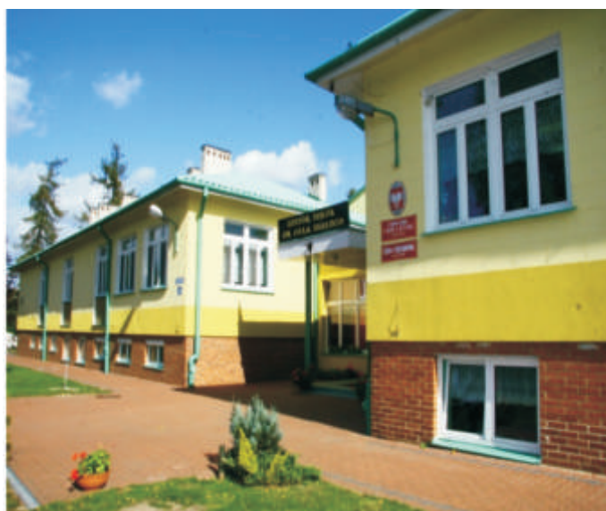
Zespół Szkół im. Orła Białego w Kobylanach

Natomiast Zespół Szkół Zawodowych po przeniesieniu się z baraków do obiektów wojsk kolejowych i po gruntownej ich modernizacji dzisiaj może poszczycić się pięknym lokum. Od 1993 roku szkoła nosiła nazwę Zespołu szkół Kolejowych natomiast dzisiaj - po reformie oświatowej w 1999 roku - jest to Zespół Szkół im. Wł. St. Reymonta w Małaszewiczach, w którym mieści się Liceum Ogólnokształcące oraz Gimnazjum Publiczne funkcjonujące, na zasadzie porozumienia z powiatem.