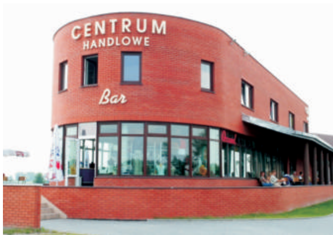
Centrum handlowe w Polatyczach