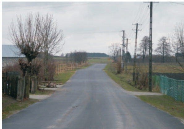
Ulica Zastawek w Małaszewiczach Małych