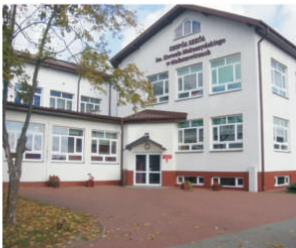
Zespół Szkół im. K. Makuszyńskiego w Małaszewiczach