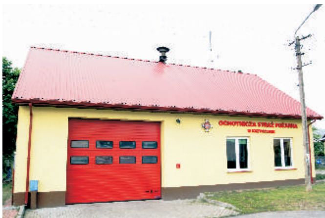
Remizo wietlica w Krzyczewie