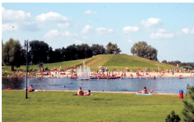
K pielisko w Kobylanach