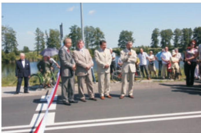
Otwarcie zmodernizowanej drogi powiatowej Koroszczyn – Kobylany - Lebień