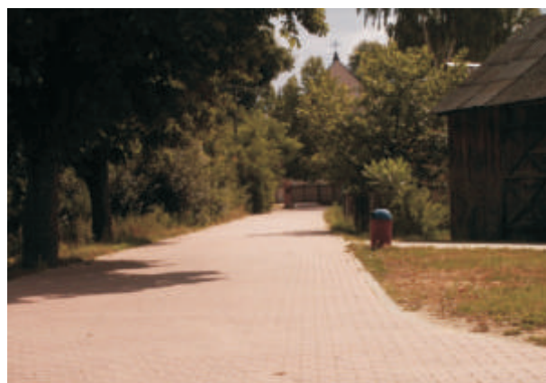
Ulica Kościelna w Neplach