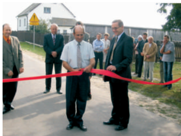
Kołpin Ogrodniki - otwarcie drogi.