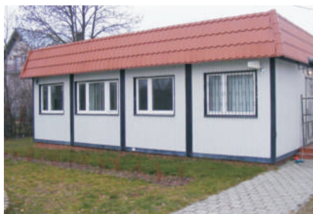
wietlica wiejska w Łobaczewie Dużym