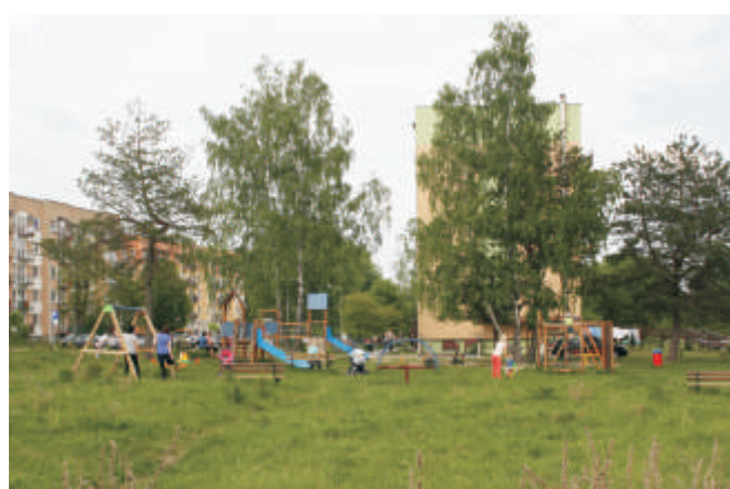
Plac zabaw w Małaszewiczach