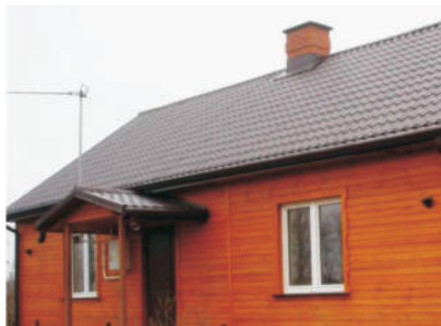
wietlica wiejska w Michalkowie