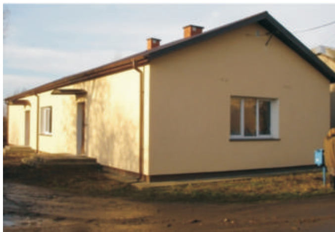
wietlica wiejska w Polatyczach