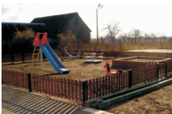
Plac zabaw w Łobaczewie Małym