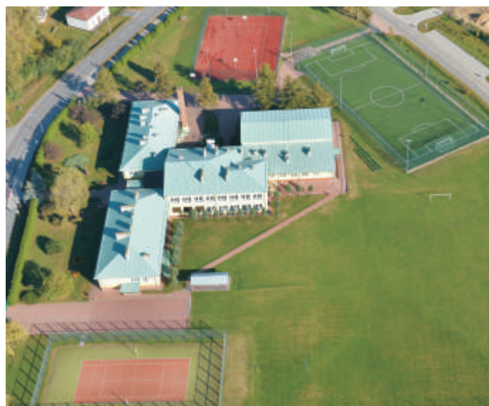
Kompleks sportowy przy szkole w Kobylanach