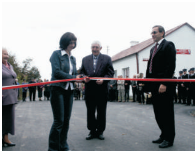
Łęgi – otwarcie drogi przez wieś