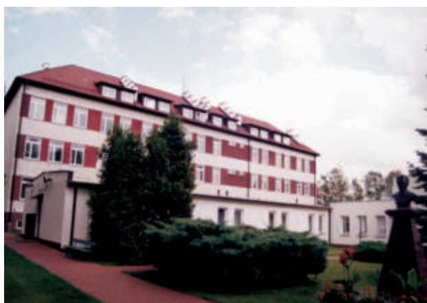
Zespół Szkół im. Wł.St. Reymonta w Małaszewiczach