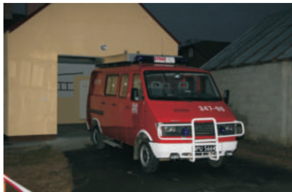
Ochotnicza Straż Pożarna w Łęgach