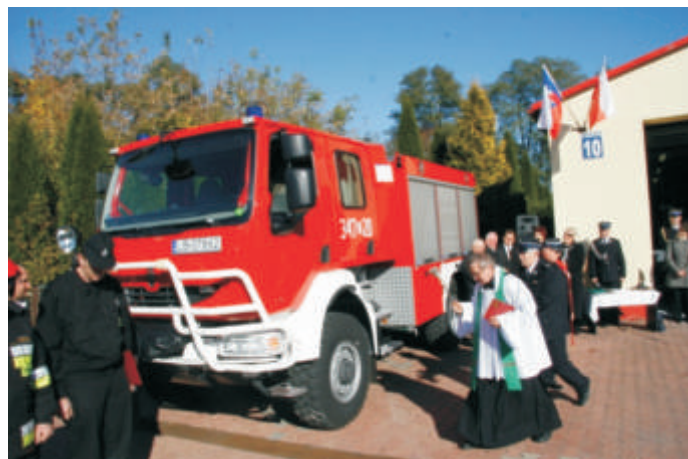
Ochothnicza Straż Pożarna w Neplach