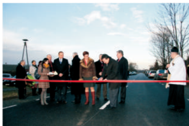
Lebiedziew - zmodernizowana Nadburżanka przez wieś