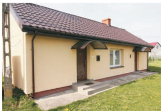
wietlica wiejska w Murawcu