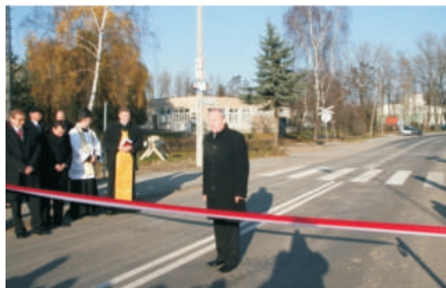
Małaszewicze otwarcie głównej ulicy Kolejowej