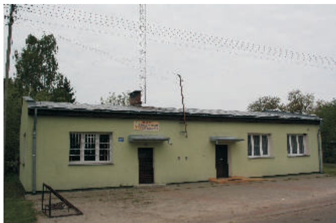
wietlica wiejska w Samowiczach