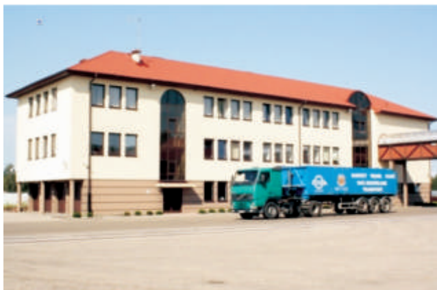
Terminal fitosanitarny w Kobylanach