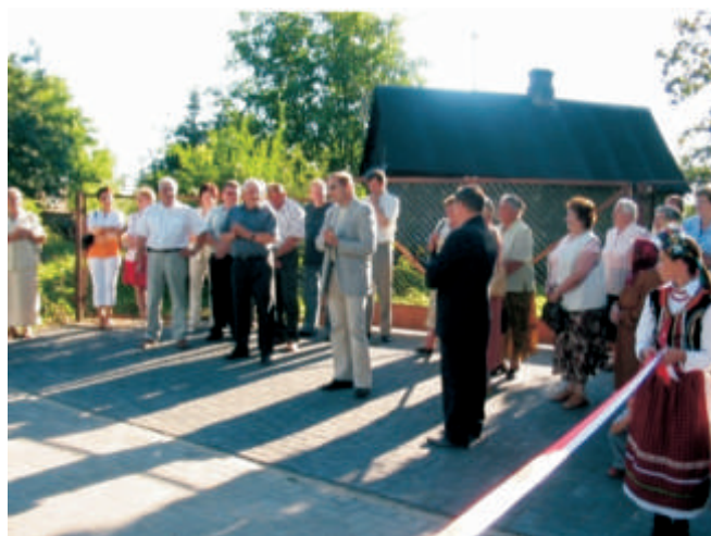
Otwarcie Ulicy Fortecznej w Łobaczewie Małym