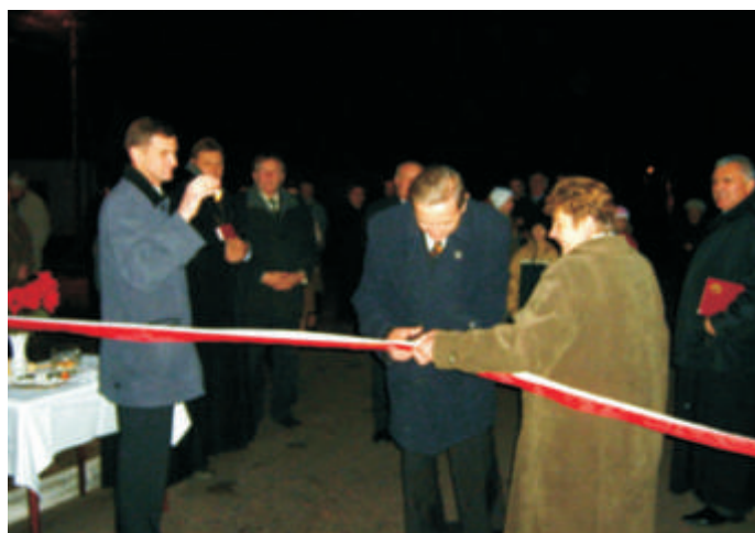
Otwarcie ulicy Krótkiej w Kobylanach