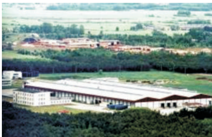
Zakłady Mięsne (dziś w ADAMPOL)