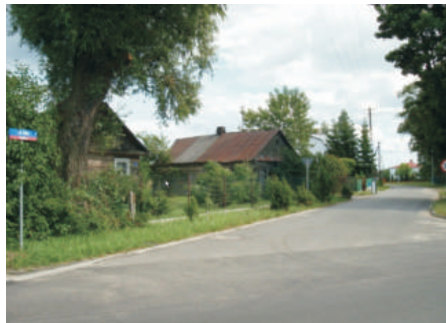
Ulica Cicha w Kobylanach