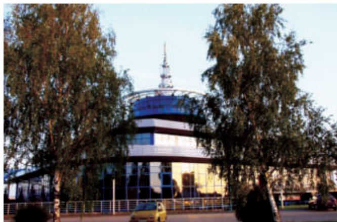
Terminal Samochodowy w Koroszczynie