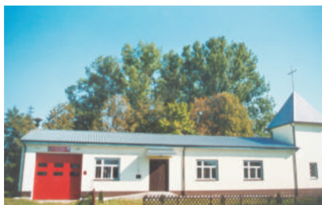
Ochotnicza Straż Pożarna w Koroszczynie mieści się przy kaplicy parafialnej

W momencie utworzenia gminy wiejskiej jedynym ośrodkiem kulturalnym w gminie był Dom Kultury Kolejarski w Małaszewiczach oraz 2 wietlice wiejskie w Łobaczewie Małym i Małaszewiczach Małych. Niestety z chwilą zaprzestania przez PKP finansowania w 1993 roku swoich placówek kulturalnych Dom Kultury z biegiem lat przestał działać, a za chwilę przestanie istnieć – pozostał zrujnowany budynek.