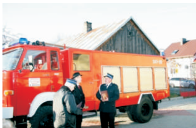
Ochothnicza Straż Pożarna w Krzyczewie