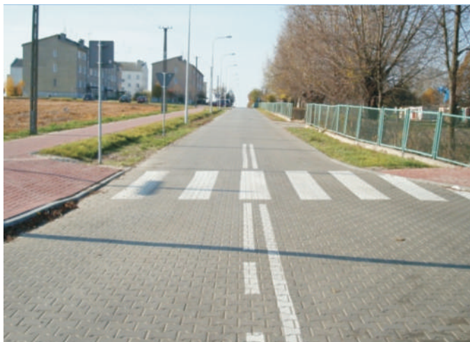
Koroszczyn - ulica Spacerowa