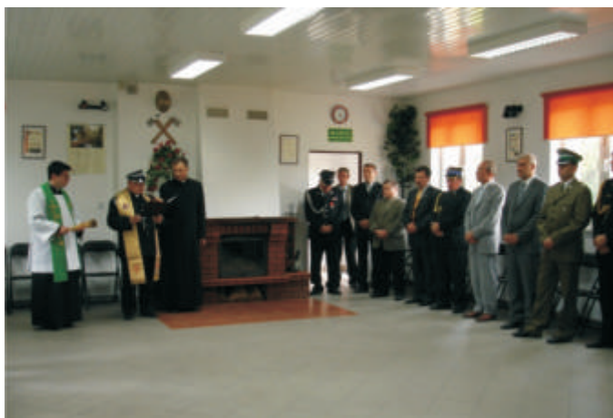
Otwarcie części wietlicowej w remizie w Neplach