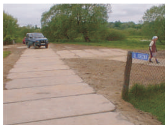
Ulica Rzeczna w Neplach