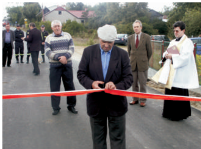
Krzyszew – otwarcie drogi przez wieś