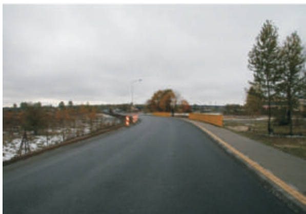
Małaszewicze Małe - ulica Portowa „Schetynówka”