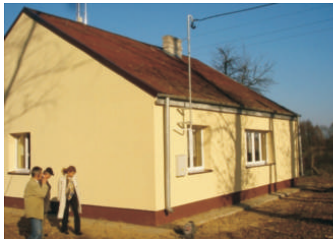
wietlica wiejska w Bohukałach