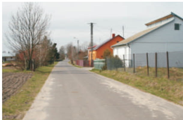
Droga w Lechutach Małych