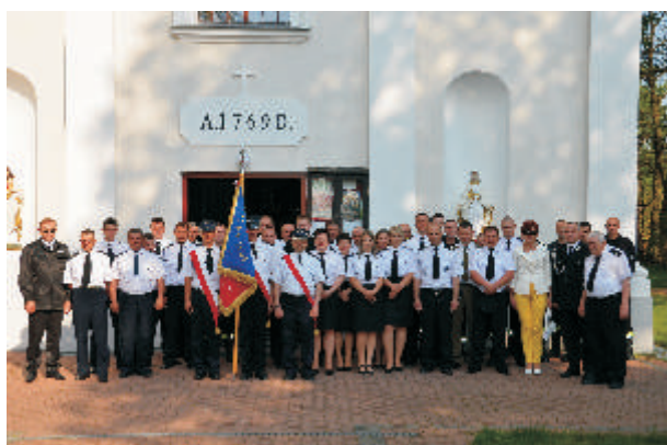
Gminny Dzieci Strażak