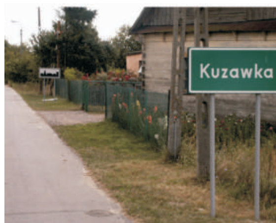
Kuzawka - droga przez wieś