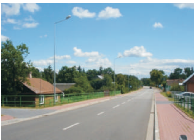
Bohukały - droga wojewódzka z Janowa Podlaskiego do Terespoła „Nadbużanka” po modernizacji

Do 1992 roku jedyną gminną drogą z nawierzchnią asfaltową była ulica w Łobaczewie Małym. Wówczas drogi powiatowe i drogi wojewódzkie na terenie gminy miały nawierzchnie asfaltowe. W 1992 roku gmina wybudowała pierwszą drogę utwardzoną – ulicę Wiejską w Małaszewiczach o długości 300 m. Dziś drogi utwardzone mają wszystkie miejscowości w gminie. W ciągu 20 lat istnienia gminy utwardzili my nawierzchnie we wszystkich miejscowościach, w sumie 90 km dróg gminnych. W miejscowościach o największym natężeniu ruchu powstały chodniki i ścieżki rowerowe, razem 12,5 km, wszędzie zostały wybudowane też zjazdy na posesje. Dzięki dobrej współpracy z władzami województwa lubelskiego gruntownej modernizacji doczekała się tzw. Nadbużanka. Wzorem wspólnego przedsięwzięcia ze starostą białskim była przebudowa drogi powiatowej Koroszczyń–Kobylany–Lebiedziew. W sumie na drogi w gminie Terespol w ostatnim 20-leciu wydano około 158 mln zł. Samorząd lokalny zrealizował 40 inwestycji drogowych. Pomogły w tym przedakcesyjne i akcesyjne środki Unii.