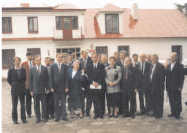
Rada Gminy Terespol I kadencja

23 lutego 1992 r. w wyborach uzupełniających do Rady Gminy Terespol wybrano 7 radnych. Dołączyli oni do 14 radnych z terenu gminy wybranych w 1990 roku do Rady Miasta i Gminy Terespol. Pierwsza sesja nowoutworzonej gminy wiejskiej Terespol odbyła się 28 lutego 1992 roku w świetlicy wiejskiej w Łobaczewie Małym, wybrano wówczas władze gminy Terespol. Zarząd Gminy rozpoczął urzędowanie w siedzibie przy ul. Wojska Polskiego 47 w Terespolu, w dawnym budynku Zarządu gminy Kobylany.