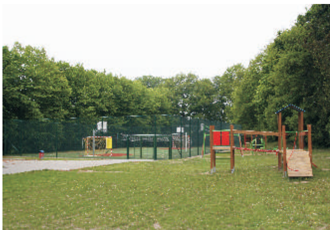
Kompleks sportowy przy szkole w Neplach