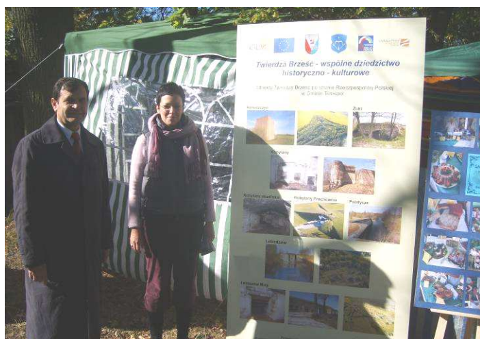
Promocja projektu podczas festiwalu w Rossoszu

Szczegółowe informacje na temat projektu, realizacji poszczególnych działań oraz jego efektów są dostępne na stronie internetowej Gminnego Ośrodka Kultury w Koroszczynie: www.gok-koroszczyn.pl . Zachęcamy także do odwiedzenia pierwszej mapy interaktywnej Fortów oraz terenu przygranicznego objętego projektem. Na uwagę zasługuje fakt, iż Album Fotograficzny zrealizowany w ramach projektu jest pierwszą publikacją, obejmującą obiekty pozostałości Twierdzy zarówno po polskiej jak i po białoruskiej stronie. Ta publikacja znalazła swoje uznanie w oczach ekspertów, a także władz Euroregionu Bug jako jedno z najlepszych wydawnictw, które zostało opracowane w ramach tej edycji grantów.