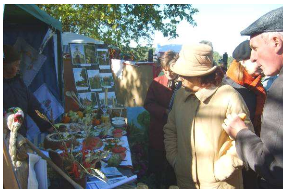
Stoisko Gminy Terespol