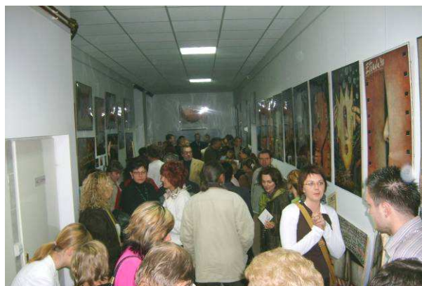
Publiczność podczas wernisażu