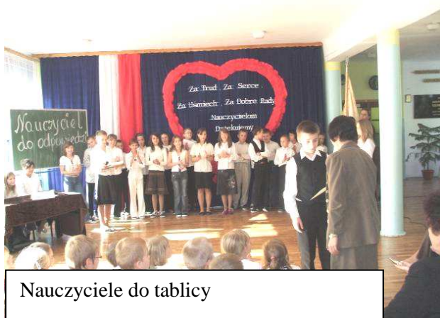
Nauczyciele do tablicy

W Szkole Podstawowej im. Juliana Ursyna Niemcewicza w Neplach uroczystość był obchodzony DZIEŃ EDUKACJI NARODOWEJ. Uczniowie w humorystyczny sposób ukazali pracę nauczyciela w programie artystycznym pt. „Nauczyciel do odpowiedzi”. Nie zabrakło wzruszeń i uśmiechu tego dnia, zaproszenie goście, emeryci i rodzice mogli w sposób szczególny brać udział w tej uroczystości. Tego dnia wręczono także nagrody uczniom za udział w konkursie o patronie szkoły Julianie Ursyn Niemcewicz, a zasłużonemu nauczycielom i pracownikom szkoły - nagrody dyrektora.