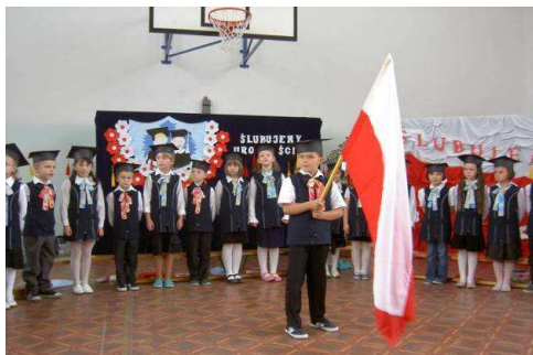
Ślubowanie w Małaszewiczach...

W dniu 19.10.2007 uczniowie klasy pierwszej Zespołu Szkół im. K. Makuszyńskiego Szkoły