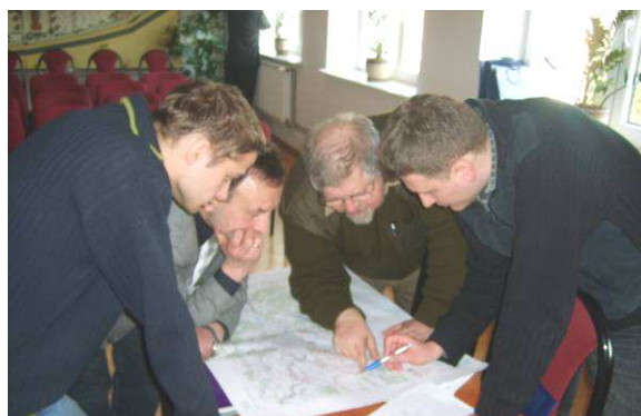
Ekspertsi podczas spotkania roboczego w GOK

Kolejnym działaniem przewidzianym w projekcie było zorganizowanie Międzynarodowej Konferencji „ Twierdza Brześć – wspólne dziedzictwo historyczno- kulturowe ” z udziałem ekspertów