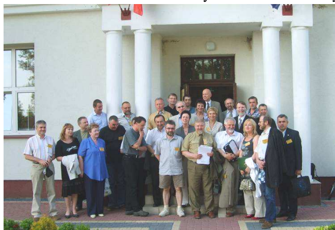
Uczestnicy konferencji przed GOK w Koroszczynie