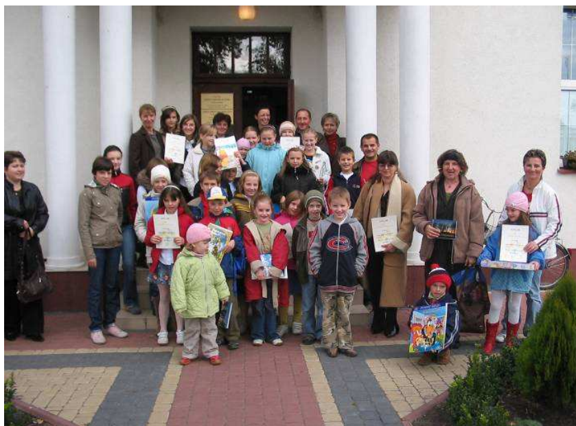
Laureaci konkursu przed budynkiem GOK w Koroszczynie