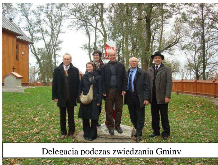
Delegacja podczas zwiedzania Gmin