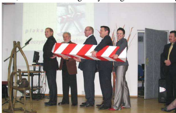
Sztuka nie zna żadnych granic..

się kilkakrotnie na plakatach wizerunek Papieża Jana Pawła II oraz Kraków organizatorzy wystawy zaprosili wszystkich zebranych do obejrzenia prezentacji zdjęć poświęconych Janowi Pawłowi II, Miastu Kraków, a także ukochanym przez Papieża górcom. Ten element wernisażu korespondował z niedawno zakończonymi obchodami Dnia Papieskiego. Profesor poinformował także, iż pracuje nad dziełem PAPIEŻ WĘDROWIEC, który będzie miał 2 metry wysokości. Mistrz podczas wernisażu wygłosił także krótki wykład na temat sztuki plakatu,