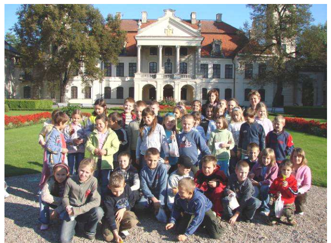
Uczestnicy wycieczki w pracowni lalkarskiej i przed muzeum