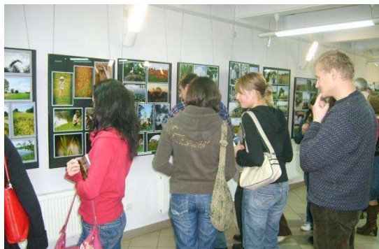
Wystawa w MOK w Białej Podlaskiej

W dniu 26 października br. w Miejskim Ośrodku Kultury w Białej Podlaskiej miało miejsce otwarcie wystawy poplenerowej „Gmina Terespol w obiektywie”.