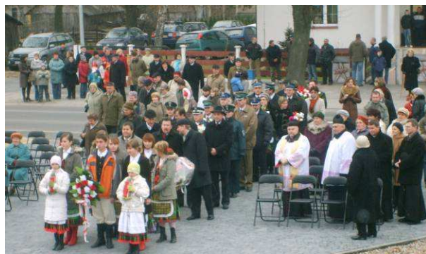
Zaproszeni goście i mieszkańcy gminy przed pomnikiem w Koroszczynie