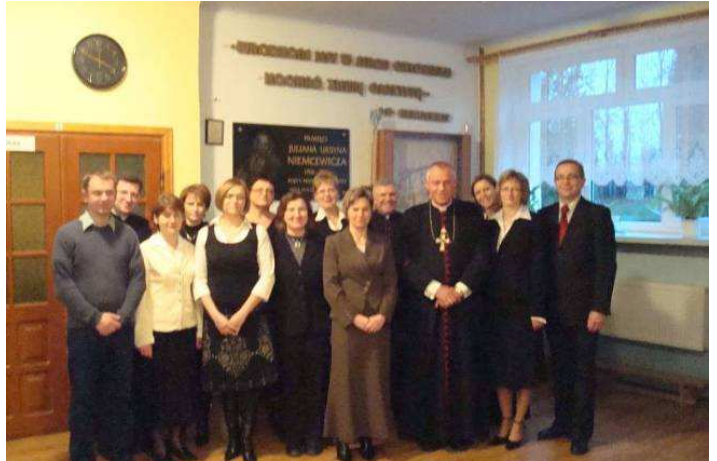
Z gronem pedagogicznym i władzami Gminy