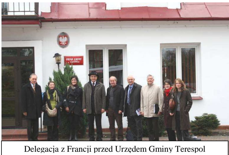
Delegacja z Francji przed Urzędem Gminy Terespol