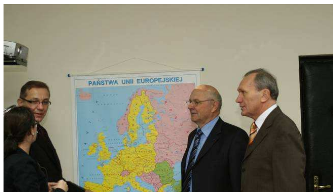
Spotkanie w gabinecie Wójty Gminy Terespol