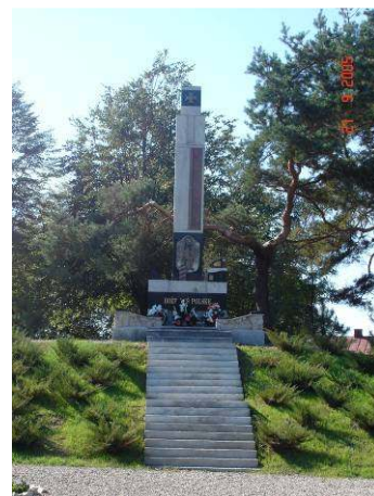
Pomnik Niepodległości w Koroszczynie

Centrum Informacji, by następnie powołać Gminny Ośrodek Kultury w Koroszczynie.