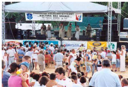
Przegląd folklorystyczny "Kultura bez granic"

W ramach wsparcia z Euroregionu Bug, wspólnie z partnerem, jakim jest Brześć oraz innymi samorządami, dzięki doskonałej współpracy z polskim konsulatem w Brześciu staraliśmy się o normalniejszą granicę z Białorusią, która stanie się inkubatorem przedsiębiorczości w przypadkach dalszej jej normalizacji, oraz o uproszczenia w jej przekraczaniu.