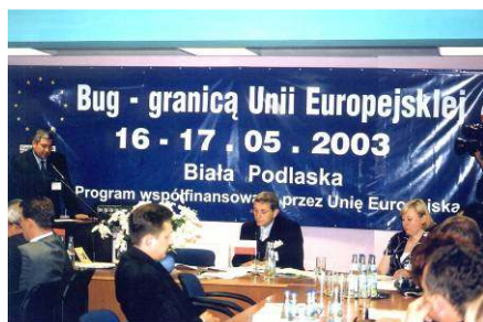
Konferencja graniczna z udziałem partnerów z Brześcia

W tym okresie w ramach dobrej współpracy z wojewodą lubelskim uporządkowaliśmy wszystkie groby wojenne, co zostało uwieńczone dokończeniem Pomnika Niepodległości w Koroszczynie,