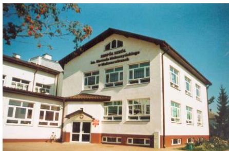
Zespół Szkół im. K. Makuszyńskiego w Małaszewiczach

Na drogi wydaliśmy około 21 mln. Powstało w tym czasie 19,2 km. nowych dróg w gminie. Przypomnę, że były to drogi: na terenie Wolnego Obszaru Celnego, w Małaszewiczach Małych, Małaszewiczach Dużych, Lechutach Małych, Lechutach Dużych, Michalkowie, Murawcu, Krzyczewie, Łęgach, Starzyńce, Samowiczach, ul. Strażacka w