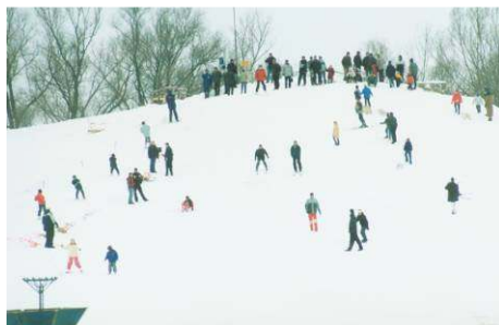
Stok narciarski w Kobylanach

Wychodząc naprzeciw służbom mundurowym oraz potrzebom szkoły im. Wł. St. Reymonta w Małaszewiczach wspólnie ze starostą stworzyliśmy strzelnicę szkolno- sportową na jednym