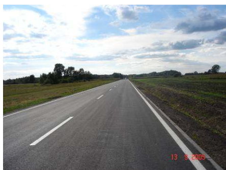
Droga Kobylany - Lebiedziew

Można zatem stwierdzić, że każda złotówka wpłacona przez mieszkańca do naszej gminy została wypłacona trzykrotnie przez pomoc społeczną i jednocześnie ta sama złotówka pomnożona razy 10 trafiła na inwestycje w gminie, głównie drogi. Środki pozyskane z zewnątrz były ponad trzykrotnie większe niż podatki wpłacone przez osoby fizyczne do gminy za miniony okres.