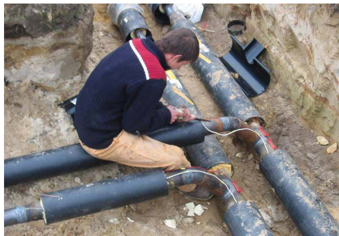
Prace przy nowej instalacji C.O.

W wyniku rozstrzygnięcia przetargu nieograniczonego realizowana jest budowa sieci ciepłowniczej wraz z modernizacją kotłowni Osiedla Mieszkaniowego Koroszczyń. Inwestorem jest Spółdzielnia Mieszkaniowa Osiedle Koroszczyń, a inwestycje finansuje Agencja Nieruchomości Rolnych Oddział Terenowy Lublin. Wykonawca, P.P.U.H „RAPID” Biała Podlaska planuje zakończenie inwestycji do końca