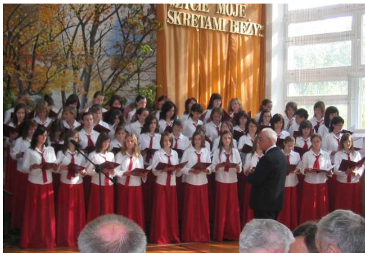
Występ chóru szkolnego