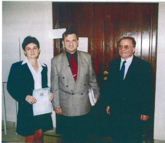
Przedstawiciele gminy Terespol w towarzystwie ministra Krzysztofa Szamałka w chwilę po wręczeniu nominacji.