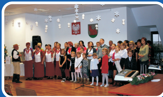
II NOWOROCZNY PRZEGLĄD KOŁĘD I PASTORAŁEK