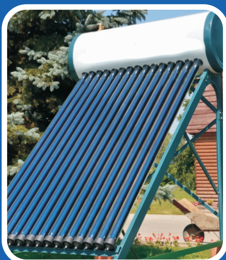
DOTACJE NA ODNAWIALNE ŹRÓDŁO ENERGII