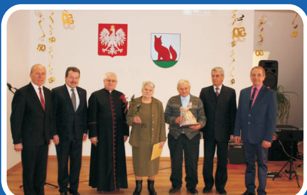
ZŁOTE GODY W GMINIE TERESPOL