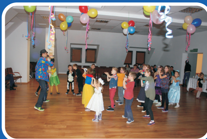
FERIE ZIMOWE W GMINIE TERESPOL Z GMINNYM CENTRUM KULTURY