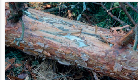
Fot. 6. Sinizna drewna spowodowana żerem kornika ostrozębnego.

Charakterystyczną cechą zabitych drzew jest też szaro – niebieska barwa bielastej części drewna, ponieważ kornik ostrozębny przenosi zarodniki grzybów powodujących tzw. siniznę drewna (fot. 6).