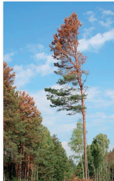
Fot. 5. Zamierająca sosna zaatakowana przez kornika ostrozębnego.

Początkowym objawem zaatakowania drzewa przez kornika ostrozębnego jest niewielka zmiana koloru igliwia, które stopniowo blednie i szarzeje. Ta zmiana jest jednak trudna do zauważenia.